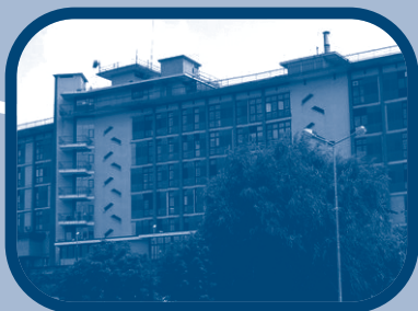
Ospedale di Ivrea

Si ringrazia per il contributo incondizionato: