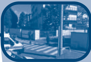
Ospedale di Ciriè

Direttore Cardiologia Ospedale di Ciriè e di Ivrea